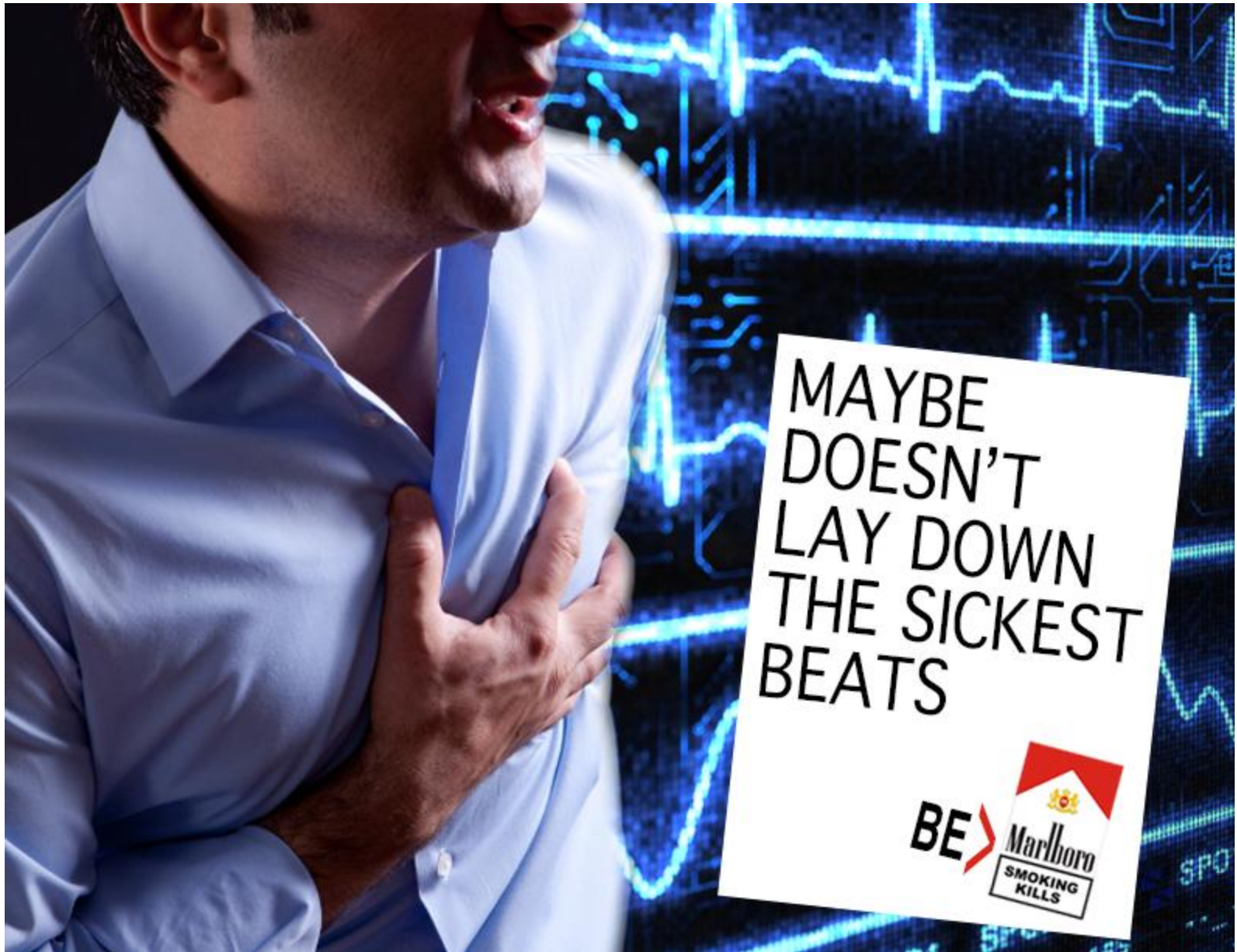
ZALANTZARIK EZEAN, TAUPADA AHULAK EZ DIRA INDARTUKO IZAN ZAITEZ MARLBORO. ERRETZEAK HIL EGITEN DU.