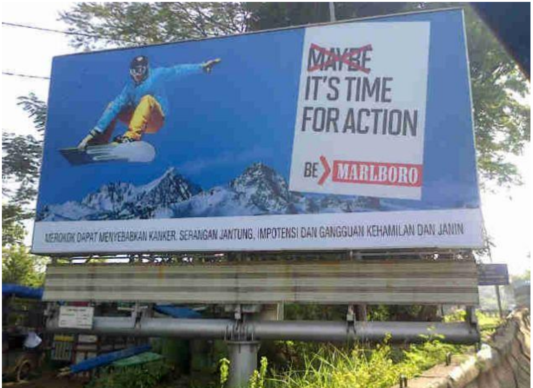
ZALANTZARIK GABE, EKITEKO ORDU IZAN ZAITEZ MARLBORO