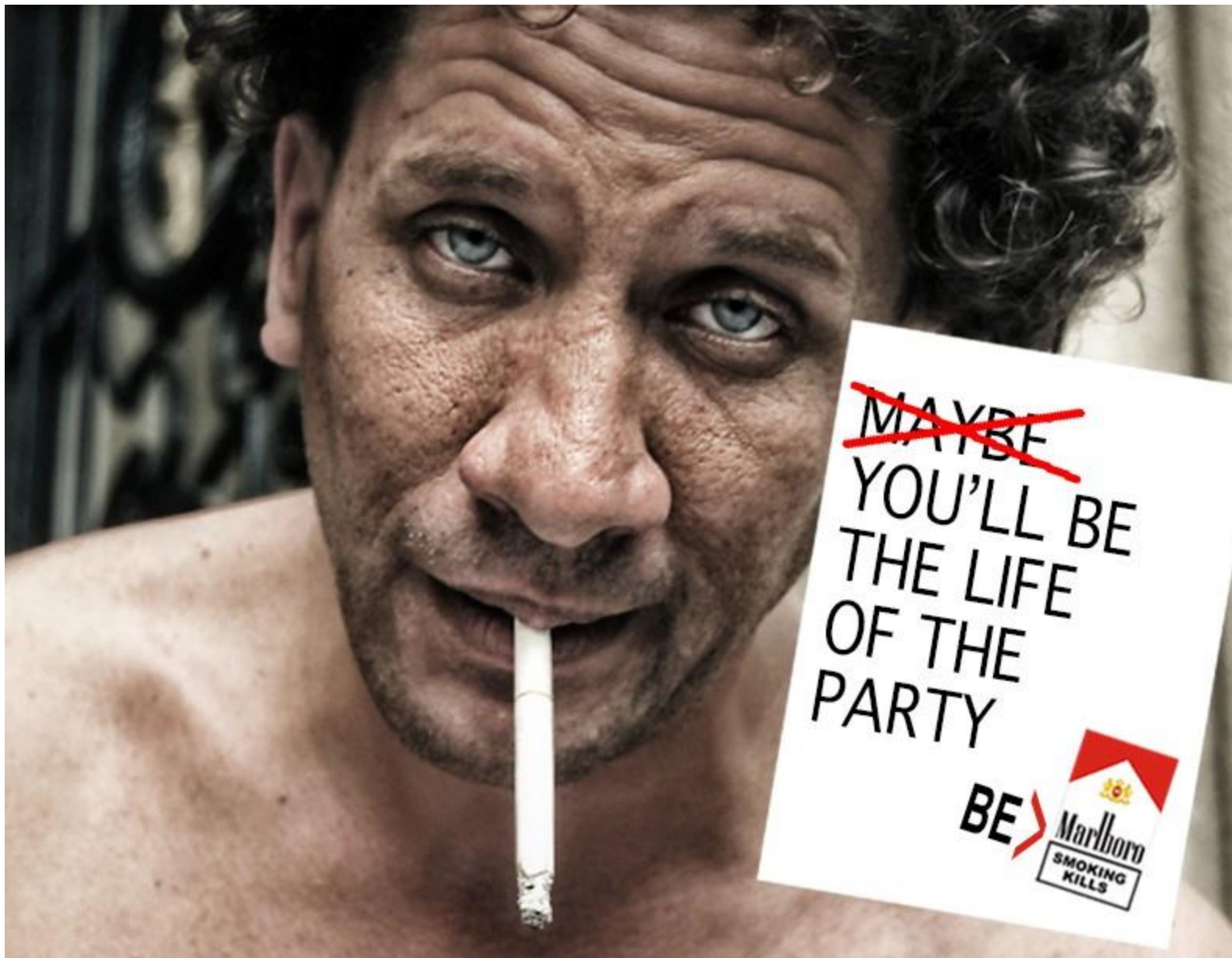
ZALANTZARIK GABE, FESTAKO BIZIPOZA IZANGO ZARA IZAN ZAITEZ MARLBORO. ERRETZEAK HIL EGITEN DU.