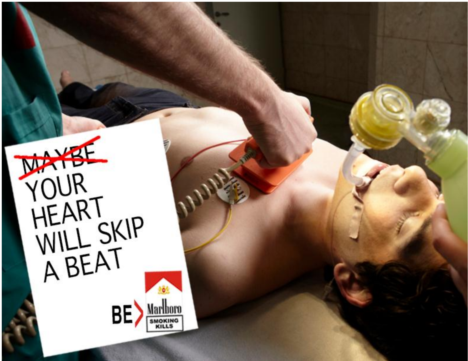
ZALANTZARIK EZEAN, ZURE BIHOTZAK HUTS EGINGO DU IZAN ZAITEZ MARLBORO. ERRETZEAK HIL EGITEN DU.