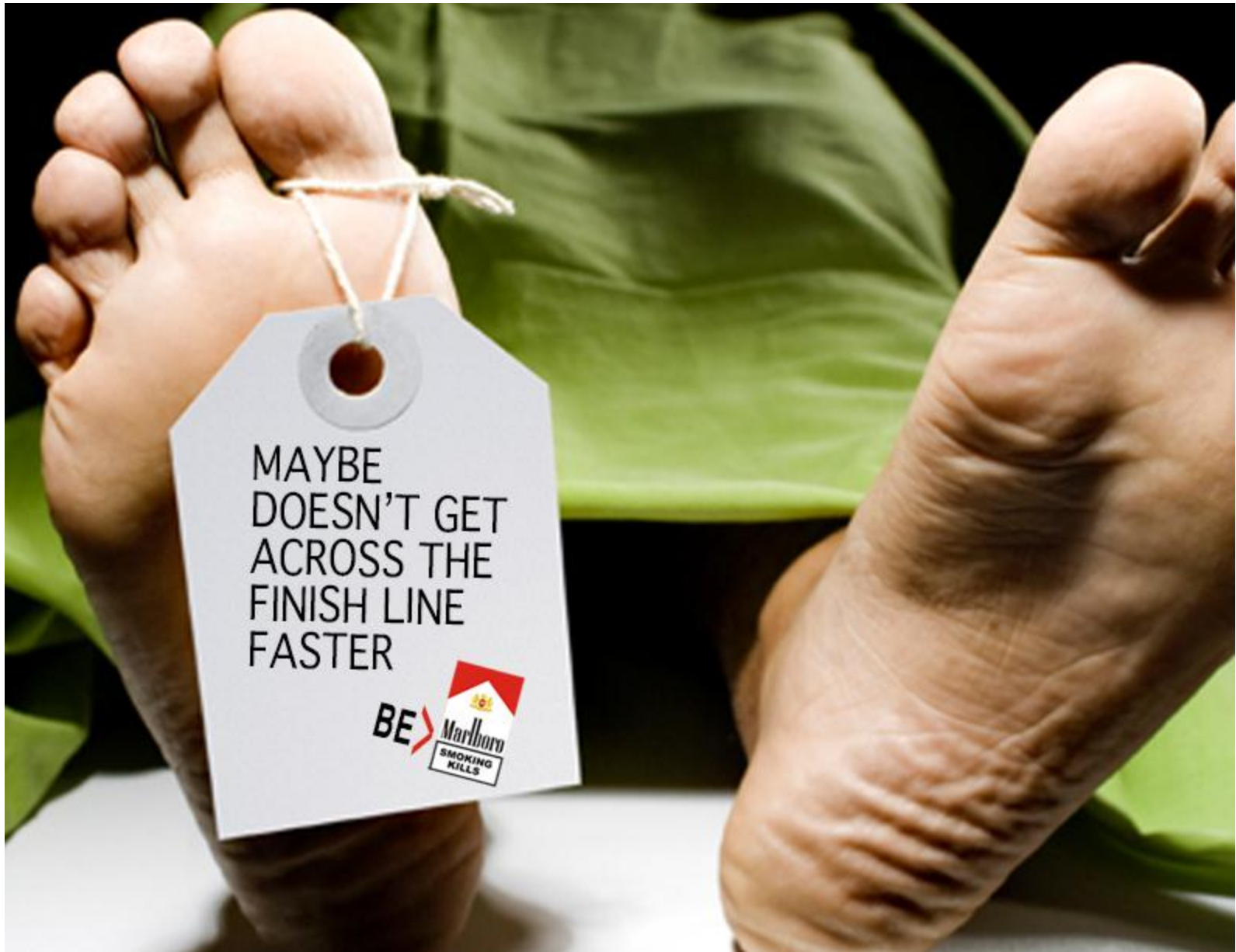
ZALANTZARIK EZEAN, HELMUGARA AZKARREGI IRITSIKO ZARA IZAN ZAITEZ MARLBORO. ERRETZEAK HIL EGITEN DU.