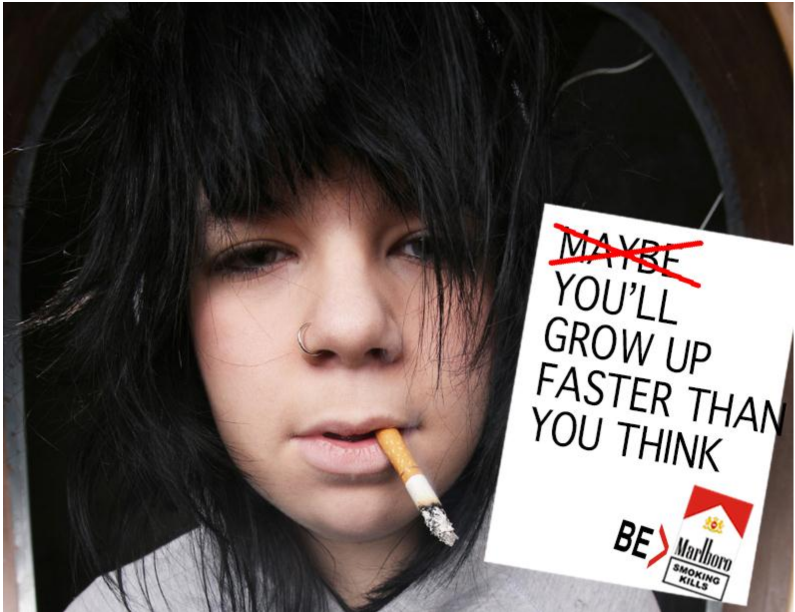
ZALANTZARIK EZEAN, USTE DUZUNA BAINO LEHENAGO HAZIKO ZARA IZAN ZAITEZ MARLBORO. ERRETZEAK HIL EGITEN DU