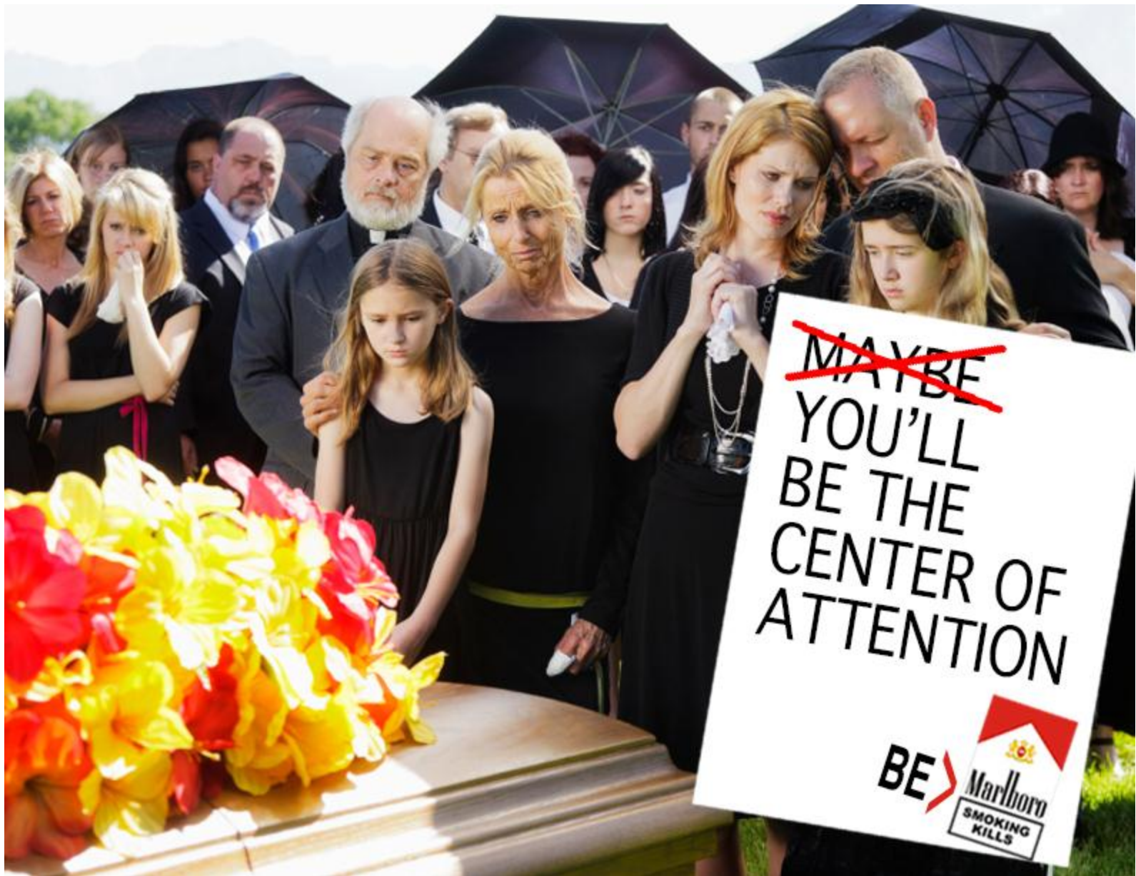
ZALANTZARIK EZEAN, ARRETA GUZTIA ZUGAN EGONGO DA IZAN ZAITEZ MARLBORO. ERRETZEAK HIL EGITEN DU.